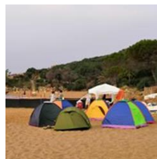
Figura 10 Campo di preparazione alla schiusa