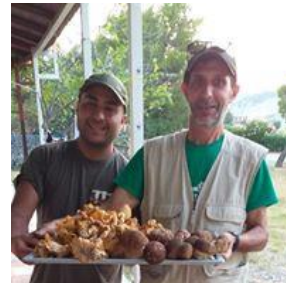
Figura 24 raccolta funghi