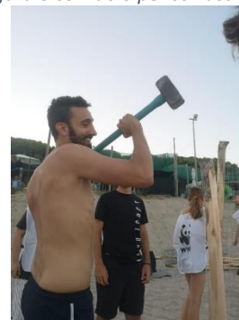
Messa in sicurezza nido