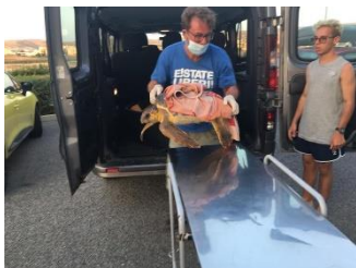
Figura 1 (recupero tartaruga marina)

Il periodo estivo nella provincia crotonese vede una forte pressione antropica sia sulle coste che nelle aree dell'entroterra di particolare prestigio naturalistico, mettendo in serio pericolo il già delicato habitat di numerose specie in via d'estinzione. I ragazzi del Centro di Recupero (figura 1) nei mesi estivi hanno bisogno più che mai di sostegno sia per l'alto numero di chiamate per soccorrere rapaci o altri animali, sia perché grazie a una convenzione con l'A.M.P. Caporizzuto monitoriamo la costa lunga 42 km alla ricerca di nidi e gestiamo il centro di recupero delle tartarughe. I campi di volontariato sono stati realizzati proprio con l'obiettivo di avvicinare grandi e piccoli alla natura, svolgendo ogni giorno delle attività concrete nella conservazione e tutela della flora e della fauna.