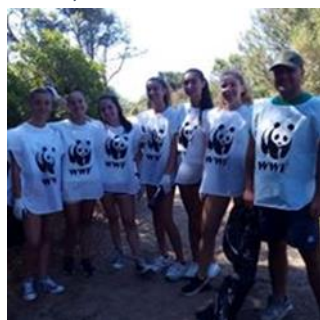
Figura 2 (volo WWF volontari)