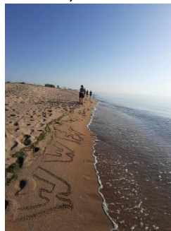
Figura 5 ricerca nidi AMP