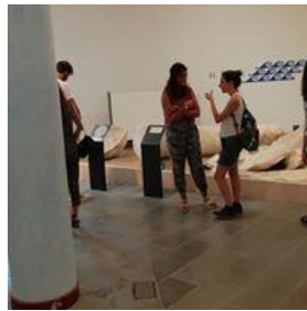
Figura 23 visita museo Capocolonna