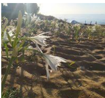
Figura 3 AMP CAPORIZZUTO-Sovereto-giglio marino

Il campo wwf nasce dalla necessità di tutelare la provincia Crotonese che, tra le sue peculiarità, ha quella di contenere L'Area Marina Protetta di Caporizzuto la seconda più grande d'Europa (foto 3-5), il Parco Nazionale della Sila (foto 4), più una serie di altre aree protette come Sovereto o l'area SIC di Montefuscaldo dove ha sede un CEA sempre gestito dal WWF Crotona. I volontari in collaborazione con gli esperti del wwf , i tecnici dell'AMP Caporizzuto , monitoreranno il territorio con particolare attenzione alle aree di particolare prestigio ambientale , naturalistico e storico.