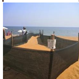
Figura 8 corridoio per schiusa