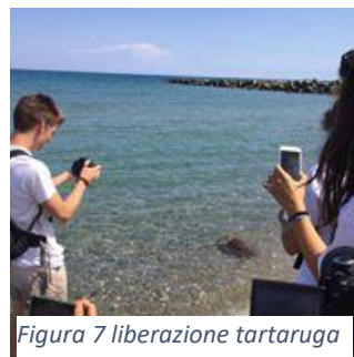
Figura 7 liberazione tartaruga

Al termine del campo verrà rilasciato un attestato di partecipazione, valevole come crediti formativi universitari oppure come alternanza scuola lavoro, in entrambi i casi è meglio prendere contatti con università e scuole per firmare convenzioni o protocolli.