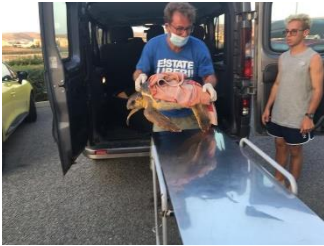
(recupero tartaruga marina)

Il periodo estivo nella provincia crotonese vede una forte pressione antropica sia sulle coste che nelle aree dell'entroterra di particolare prestigio naturalistico, mettendo in serio pericolo il già delicato habitat di numerose specie in via d'estinzione. I ragazzi del Centro di Recupero nei mesi estivi hanno bisogno più che mai di sostegno sia per l'alto numero di chiamate per soccorrere rapaci o altri animali sia perché grazie a una convenzione con l'A.M.P. Caporizzuto monitoriamo la costa lunga 42 km alla ricerca di nidi e gestiamo il centro di recupero delle tartarughe marine . I campi di volontariato sono stati realizzati proprio con l'obiettivo di avvicinare grandi e piccoli alla natura, svolgendo ogni giorno delle attività concrete nella conservazione e tutela della flora e della fauna.