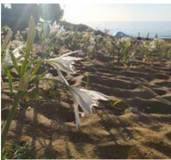
AMP CAPORIZZUTO-Sovereto-giglio marino