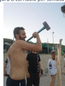
Messa in sicurezza nido