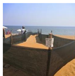
Figura 8 corridoio per schiusa