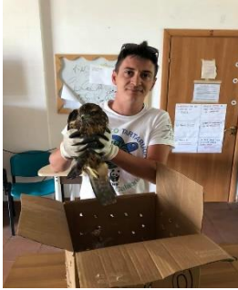
salvataggio fauna selvatica