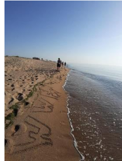
ricerca nidi AMP