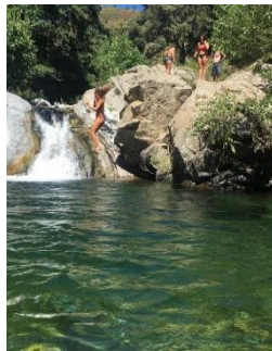
Fiume Vergari Mesoraca